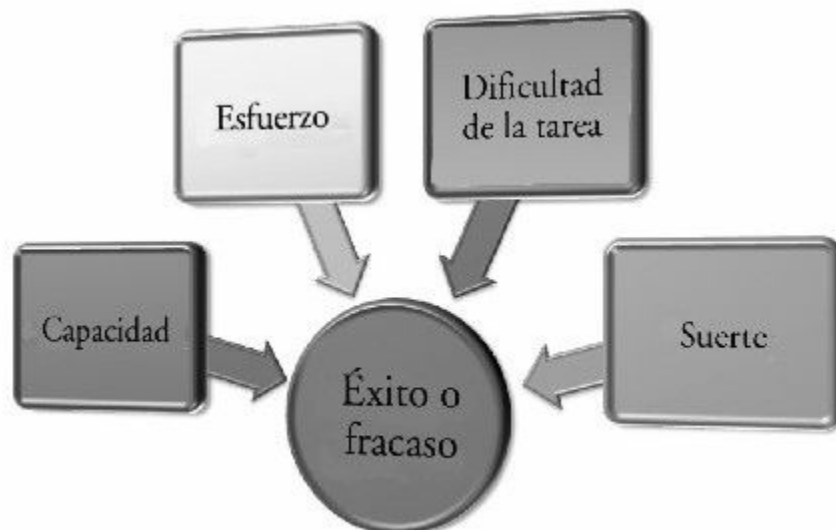
Atribución de logro, según Weiner.

Tendemos a atribuir el éxito o el fracaso a cuatro causas posibles (Weiner, 1974, 1986):